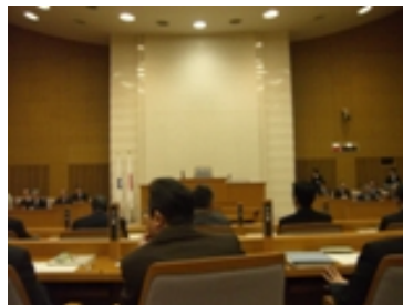
豊田市議会3月定例会