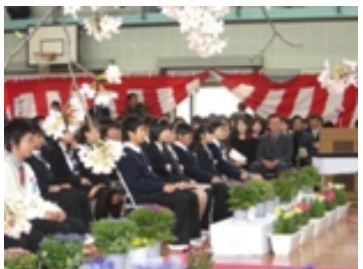
豊田市立前山小学校卒業式