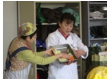
知的やじ馬サロン