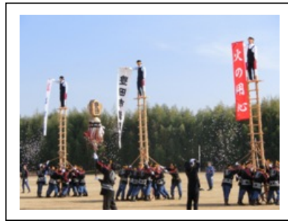
豊田市消防団 出初式