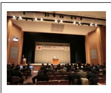
地域づくりフォーラム