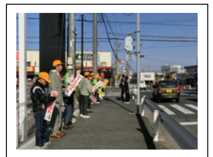
春の交通安全運動