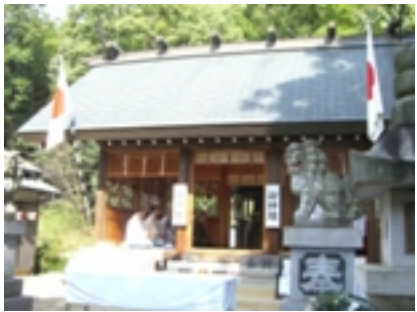
【各地区の祭礼にて、各地区の文化を大切にし、心のふれあいの場となるよう祈念します】