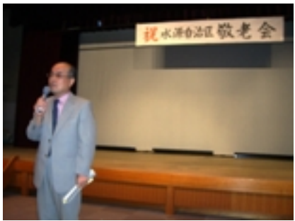
【各地区での敬老会にてごあいさつをさせていただきました。長寿万歳。】

◎9月8日(土)マレットゴルフ大会(120名) ◆◎10月7日(日)豊南交流館ふれあい祭◆