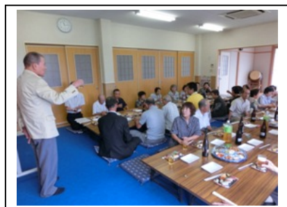
渡合自治区 敬老会