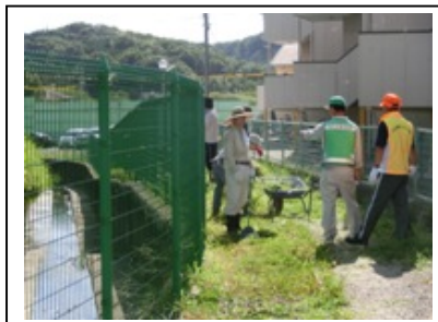
今自治区 町内一斉清掃