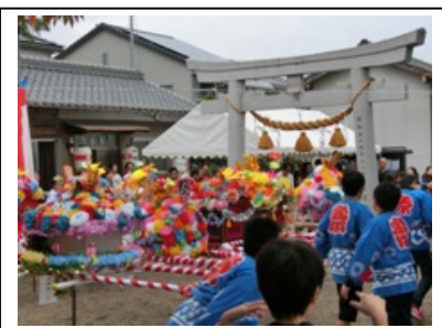
前山自治区 秋の大祭