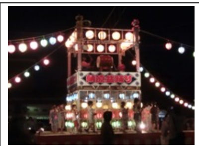
水源自治区 盆踊り大会