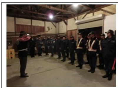
豊田市消防団 年末特別警戒